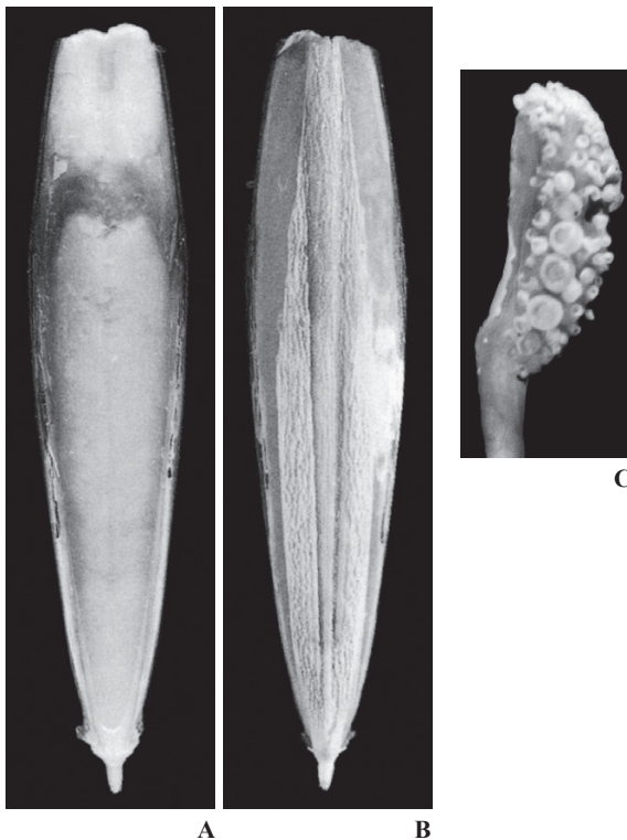
A-C : Lu (1998b)