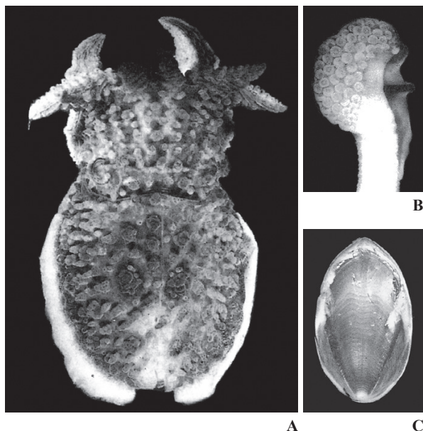
A-C : Roeleveld & Liltved (1985)