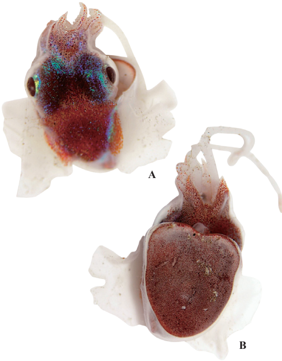
A, B: 窪寺恒己 (久米島)