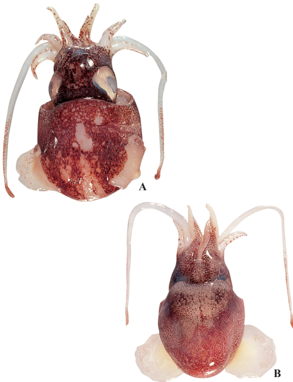
A, B : (スリナム産)