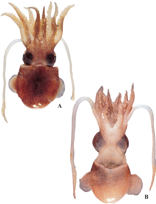
A, B : 藤倉克則 (グリーンランド)

東大西洋・地中海 East Atlantic & Mediterranean Sea