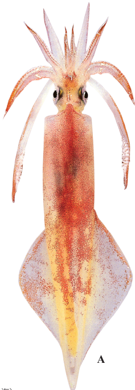
A: 田川 勝 (東シナ海)