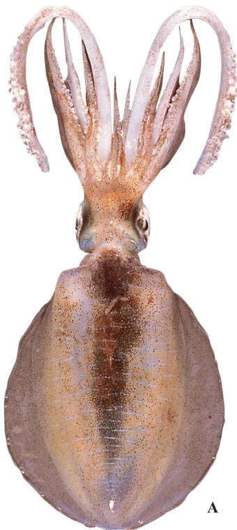
A: 田川 勝 (長崎)