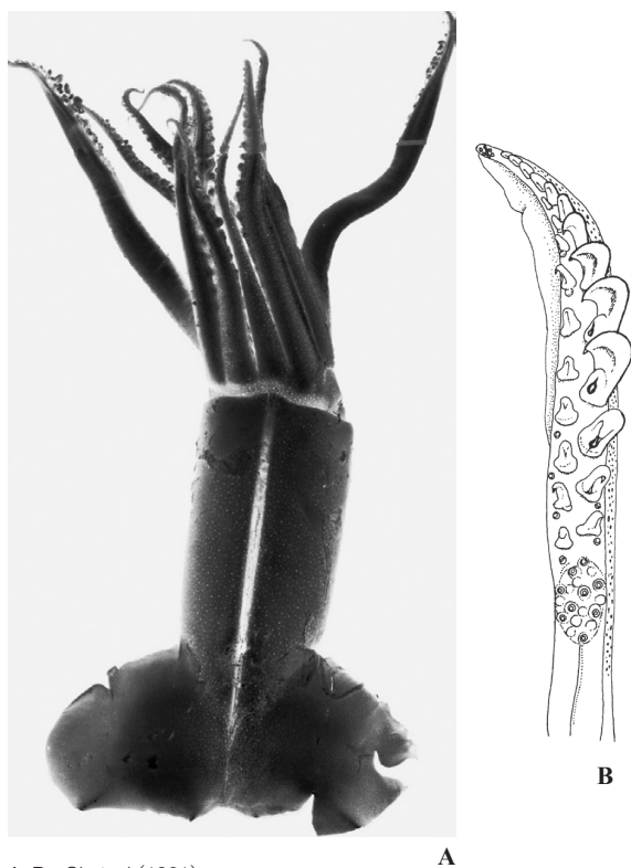
A, B : Okutani (1981)

ML 10 cm. 外套膜は円錐形。鰭は丸みがあり、長さは外套長の40~50%、幅は85~105%。腕吸盤の角質環は平滑。触腕の鉤は26~27で、背側列の第4、5番目のものは腹側の相対する鉤の3~4倍も大きい。先端小吸盤は7~9。発光組織らしいものは無い。本種は成体でも鰭が丸い点と軟甲端の特徴から、本科の何れの属とも異なり、最近新属とされた (Bolstad, 2010)。南西太平洋~インド洋南部。