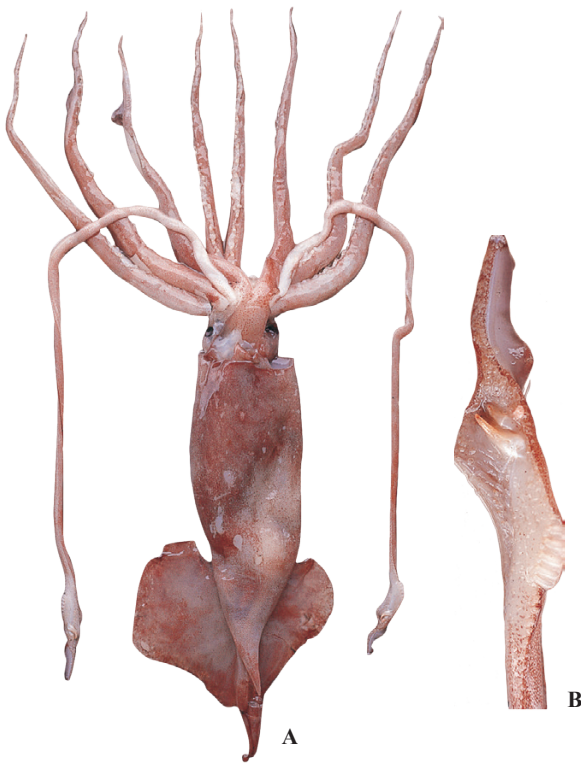
A : Kubodera & Okutani (1977). B : 窪寺恒己