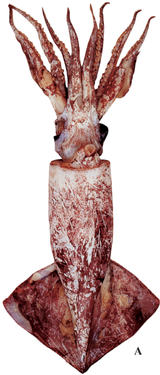
A : 窪寺恒己 (襟裳岬)