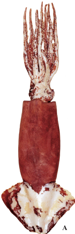
A : 遠洋水産研究所 (アフリカ沖)