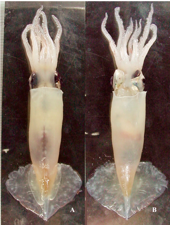
A, B : 酒井光夫

ML 150 mm. 外套膜は細長く、幅は長さの約20%。表面には微細な網目彫刻がある。鰭は菱形。頭部背面には頸軟骨から第I腕基部にかけて走るV字肉敵がある。腕は短く、保護膜は背側で低く、腹側では良く発達する。腕には泳膜の代わりに溝を持つ。腕式はII>III>IV>I。雌の吸盤角質環は平滑、雄では低く弱い歯がある。触腕は短かいが掌部は長く(外套長の33%)、吸盤の分化は不分明。掌部中央は約10列の小吸盤が疎らに並ぶ。先端部には小吸盤が環状に配列する。眼の背円周には薄い発光組織がある。軟甲の終円錐は発達する。南極海~亜南極海。