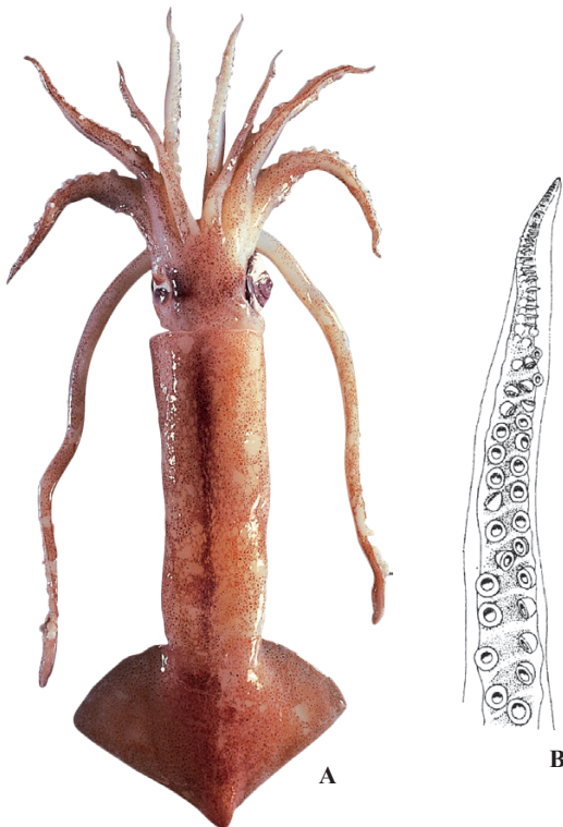
A : 遠洋水産研究所 (カナダ沖), B : Roper et al. (1984)

FAO 名 (英) : Northern shortfin flying squid 別名 : カナダイレックス, マツイカ (市場)