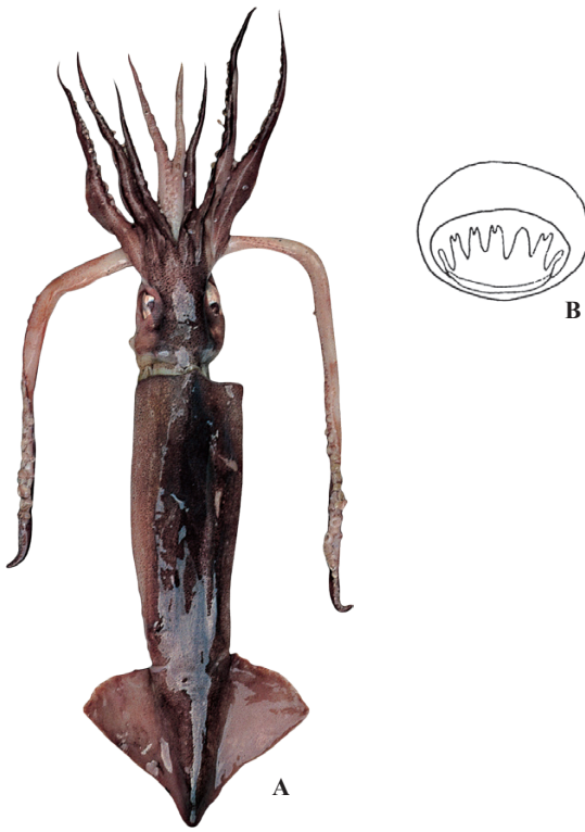
A : 遠洋水産研究所 (ナミビア), B : Roper et al. (1984)