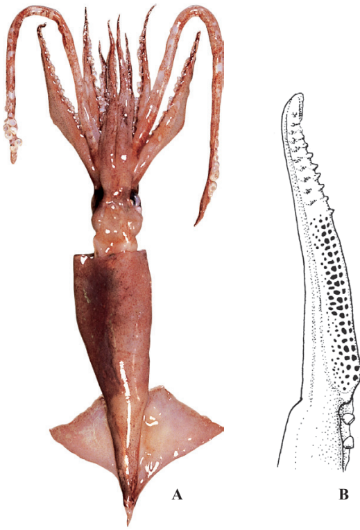
A : (スリナム), B : Roper et al. (1984)