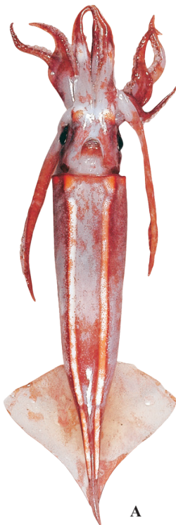
A : (三陸沖)