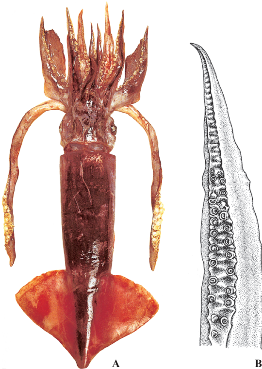
A : 遠洋水産研究所 (南西太平洋), B : Dunning & Lu (Hollis) (1998)