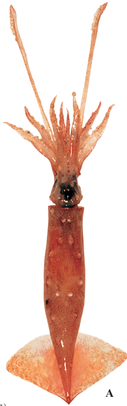
A : 田川 勝 (沖ノ鳥島)