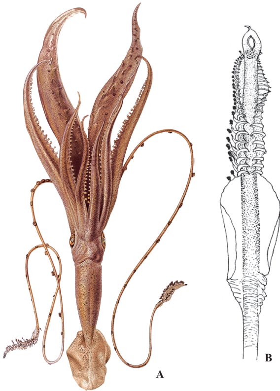
A : Joubin (1924), B : Joubin (1933)

ML 10 cm. 通常前種の西大西洋に分布する亜種とされている (Pfeffer, 1910). 重要な特徴は共通しているが, (1) 鰭は卵円型 (長さが幅の 1.5 倍). (2) 触腕の保護膜のくびれは前種のように顕著ではない. また, (3) 外套腔内の発光器はやや長卵型で両端は細まる (セイヨウユウレイイカでは卵円形.) であるのなど, 微細な形態学的相違がある. 幼若体はおそらく Doratopsis diaphana と思われる.