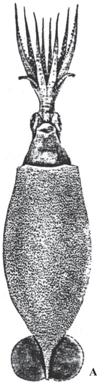
A : Young (1972)

ML 76 mm. 前種にやや似ているが、(1) 鰭は小さく外套長の23~33% (前種50~55%)。 (2) IV腕吸盤数が2~4個 (前種12~15個)。 (3) 吸盤角質環の歯は狭く25~35個 (前種では広く7~10個)。 (4) 腕先端寄りの吸盤開口は吸盤に比べて小さくなる。前種では急速に小さくなる。など多くの点で異なる。カリフォルニア沖。